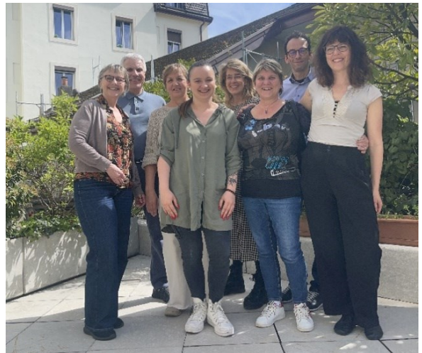
Rencontre des responsables de cours à Lausanne, mai 2023

En étroite collaboration avec Syna et avec le soutien unanime du comité directeur, une nouvelle offre de cours a été développée pour les collaborateurs syndicaux . Celle-ci est étroitement liée aux besoins professionnels des collaborateurs ainsi qu'à leur développement interne. En 2023, sept cours ont déjà été organisés dans ce contexte pour ce groupe cible (par exemple sur l'organizing et la fidélisation des membres).