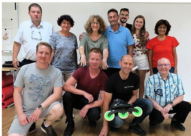
Impressions des séminaires ARC : Travail concentré et l'une des traditionnelles photos de groupe