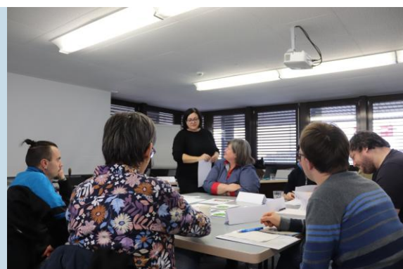
Photo: module pilote, Syna Olten

Un projet pilote mené en collaboration avec Syna et INSOS ouvre de nouvelles perspectives pour une formation continue accessible à tous et adaptée aux différents publics.