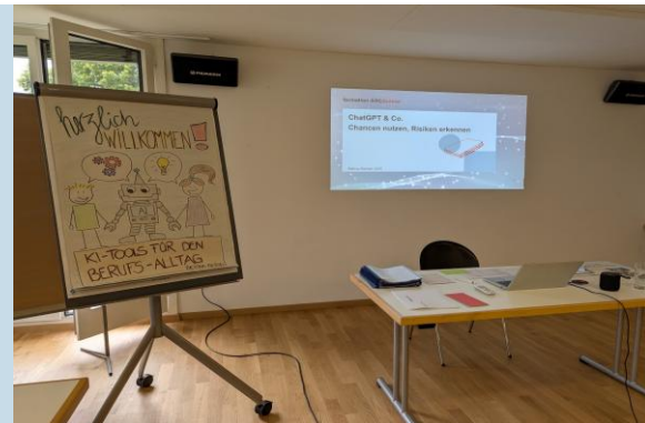
Photo tirée du cours : « Outils d'IA pour le quotidien professionnel »

L'année 2025 a été placée sous le signe de la stabilisation et du développement ciblé de notre offre.