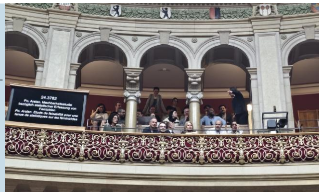
Image : « Travail.Suisse – Processus politiques et acteurs pour le renforcement des travailleurs en Suisse »

ARC est bien placé pour s'adapter aux évolutions actuelles et développer de manière ciblée son offre de formation continue.