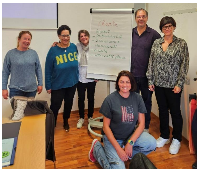
Séminaire "Se comprendre pour mieux s'entendre avec la PNL", octobre 2024

L'offre de formation de l'ARC a pu être diversifiée avec succès et adaptée de manière encore plus conséquente aux besoins des associations membres. L'offre de cours pour les collaborateur·trice·s syndicaux a notamment été développée de manière ciblée et directement intégrée au programme de formation continue.