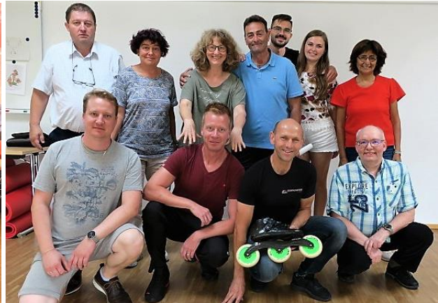
Impressionen aus den ARC-Seminaren: Konzentriertes Arbeiten und eines der traditionellen Gruppenfotos.